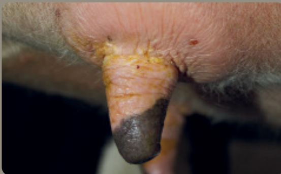
Schwellung an der Zitzenbasis

maximal 20 % der untersuchten Tiere mit mindestens einer betroffenen Zitze