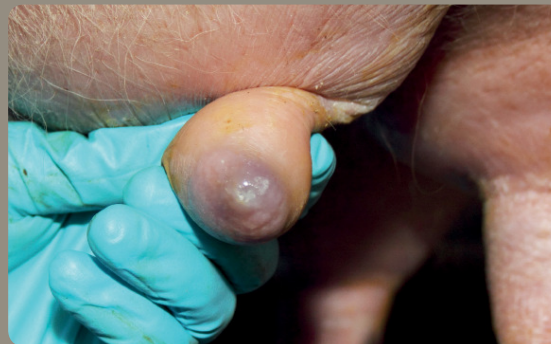
Blaufärbung und Ödem der Zitzenspitze

Wie erkenne ich akute Zitzenkonditionsstörungen?