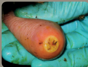
Sehr rauer Ring