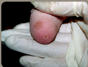
Glatter Ring um die Zitzenkanalöffnung